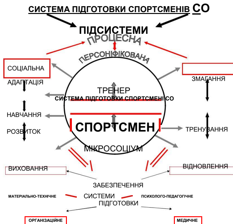
Рис. 1. Схема системи підготовки спортсменів Спеціальних Олімпіад

В персоніфікованій підсистемі традиційно виділяють керуючий та керований компоненти . Функції керівника системи підготовки виконує тренер, який повинен забезпечити взаємозв'язок усіх ланок системи підготовки, здійснити підбір засобів і методів тренування відповідно до індивідуальних можливостей спортсмена. Керований компонент включає спортсмена, який, власне, є центральною постаттю усієї системи підготовки та мікросоціум – найближче оточення спортсмена з вадами інтелекту.