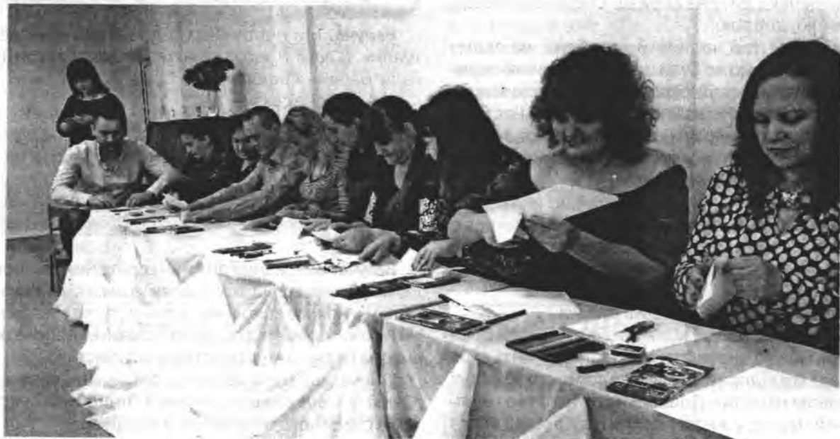
Батьки виготовляють «Родинний корабель»

Головне правило цього острова — висловлювати все через малюнок. Тож вам доведеться дотримуватися цього правила та зобразити взаємини членів сім'ї за допомогою зображення явищ природи. Потім ви маєте презентувати свою роботу решті учасників.