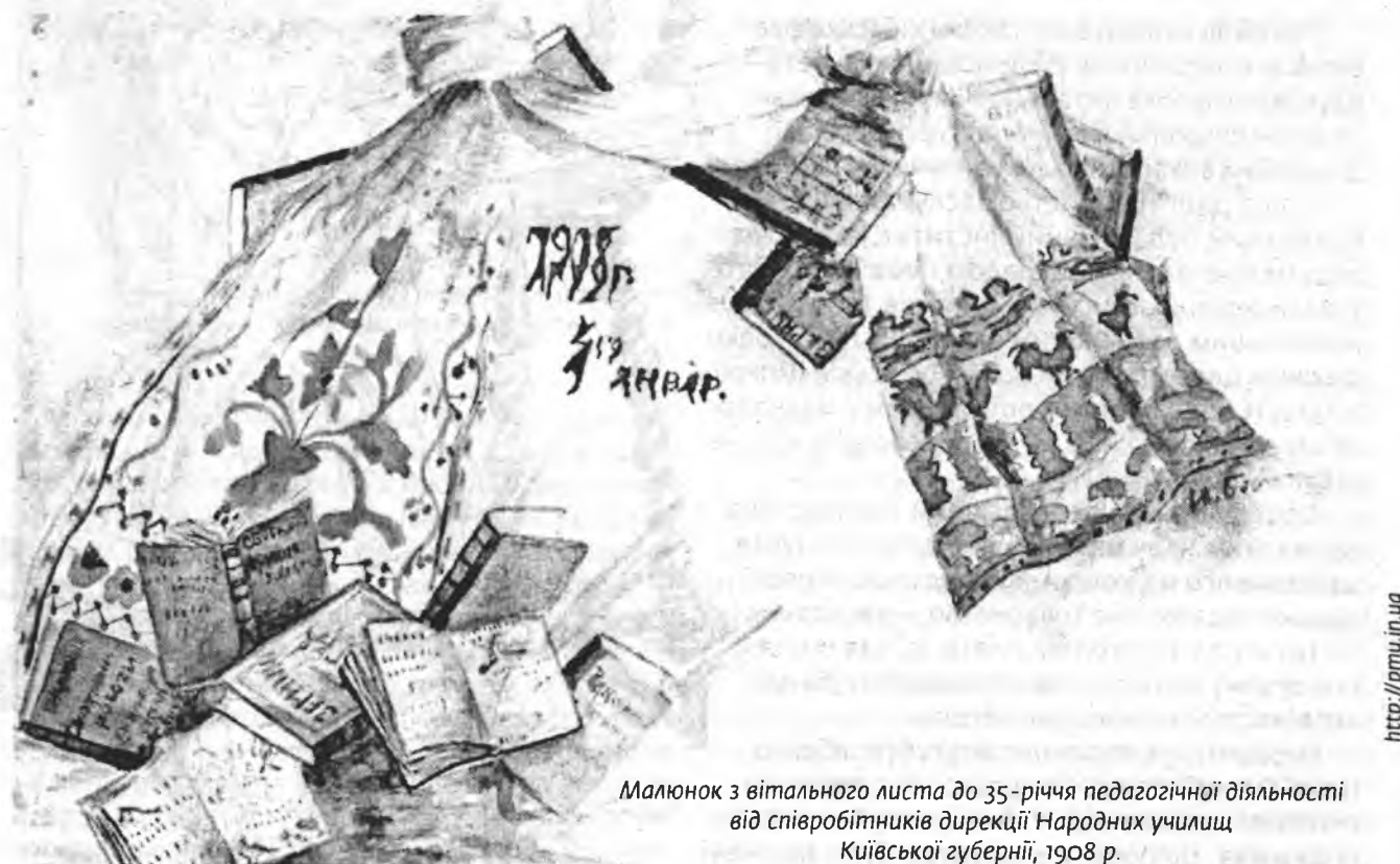
Малюнок з вітального листа до 35-річчя педагогічної діяльності від співробітників дирекції Народних училищ Київської губернії, 1908 р.