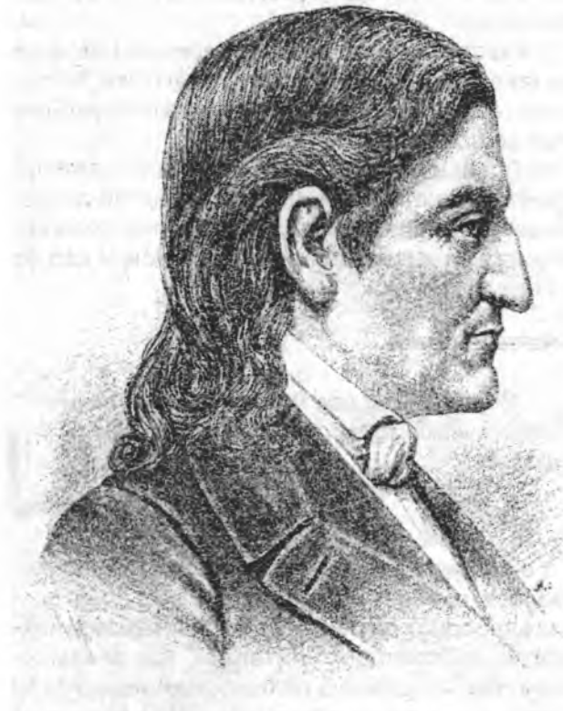
Фрідріх Фребель, німецький педагог, творець ідей і практики суспільного дошкільного виховання

Коли в Україні з'явився перший дитячий садок? В окремих виданнях вказано — 1839 рік, м. Полтава. Це майже два роки по тому, як у Бланкенбурзі відкрив свій відомий заклад Фрідріх Фребель, і за рік до того, як він вигдав саму назву — «дитячий садок». Але навряд чи цей заклад для малюків за його призначенням, організацією та змістом виховної роботи можна було назвати дитячим садком.