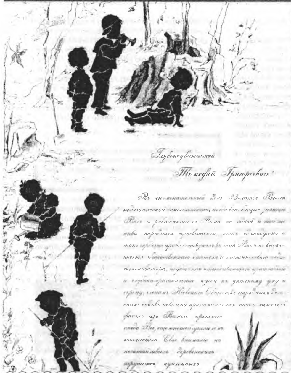
Вітальний лист до 35-річчя педагогічної діяльності від Київського Товариства народних дитячих садків