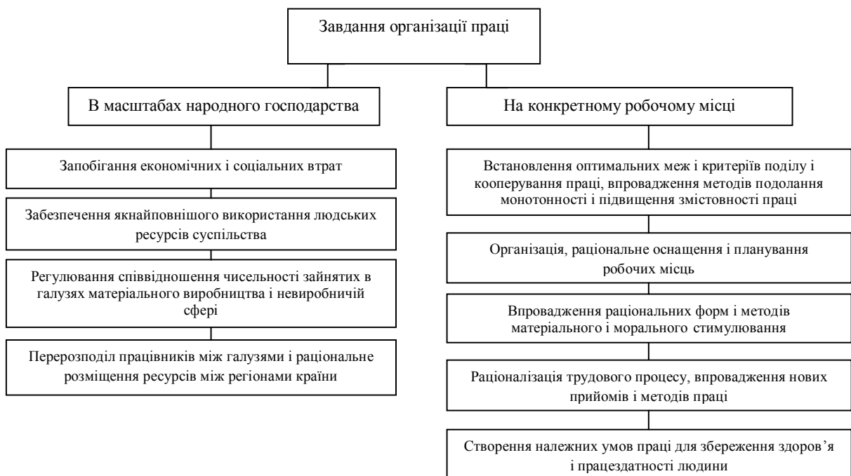
Рис. 2. Завдання організації праці

В масштабах народного господарства та на конкретному робочому місці вирішуються такі завдання організації праці, які зображуються на рис. 2.