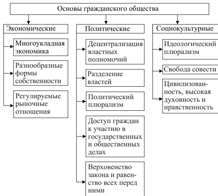
Рис. 6. Основы гражданского общества

Экономическая основа классической модели гражданского общества претерпевает сегодня существенную эволюцию (рис. 6).