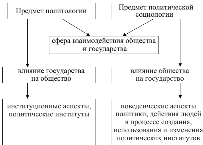
Рис. 1. Предмет политической социологии

Таким образом, предмет политической социологии не совпадает с предметом политологии: обе изучают политическую сферу взаимодействия, но с разных сторон. Предметом политической социологии является политическая власть, формы и методы ее функционирования, которая рассматривается вместе с изучением политического сознания, интересов и поведения индивидов, групп, этнических общностей и их организаций (рис. 1).