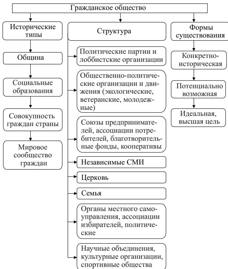
Рис. 5. Структура гражданского общества

Структуры гражданского общества во многом способствуют возникновению и успеху рыночной экономики, поскольку предпосылкой рыночной экономики является определенная социальная связь, определенный уровень доверия и социального капитала. Именно этими ресурсами и располагает гражданское общество. С другой стороны, гражданскому обществу нужен рынок. При отсутствии типичной для функционирующей рыночной экономики децентрализации экономических решений и экономической власти гражданское общество проигрывает. В то же время надо иметь в