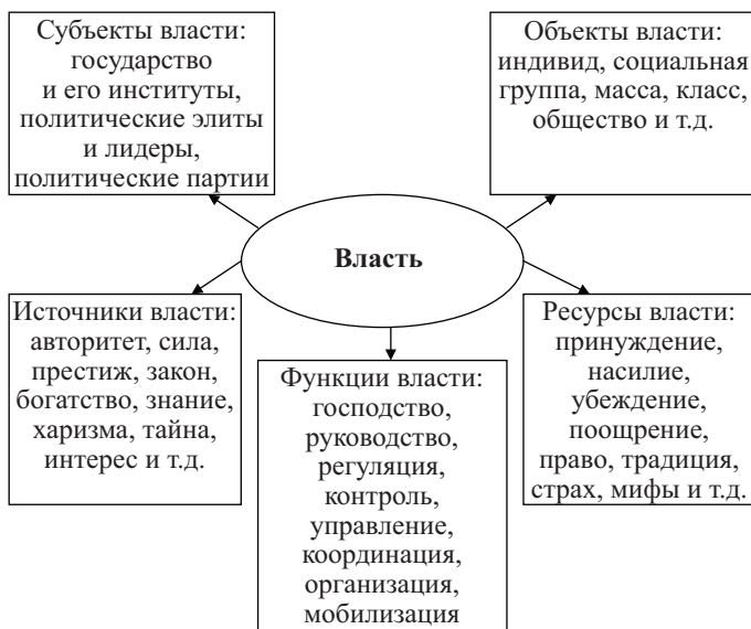
Рис. 2. Структура власти

К объектам власти относятся индивиды, общности (классы, сословия, местные сообщества) и организации, на которые направлена воля субъекта. Содержание власти включает в себя общественные отношения политического характера, а именно отношения господства – подчинения, зависимости / автономии, руководства / принятия, освоения / отчуждения. Субъект политической власти заинтересован в широкой легитимности, что вынуждает его устанавливать с объектом, волеизъявление которого становится источником власти, более разнообразные отношения (рис. 2).