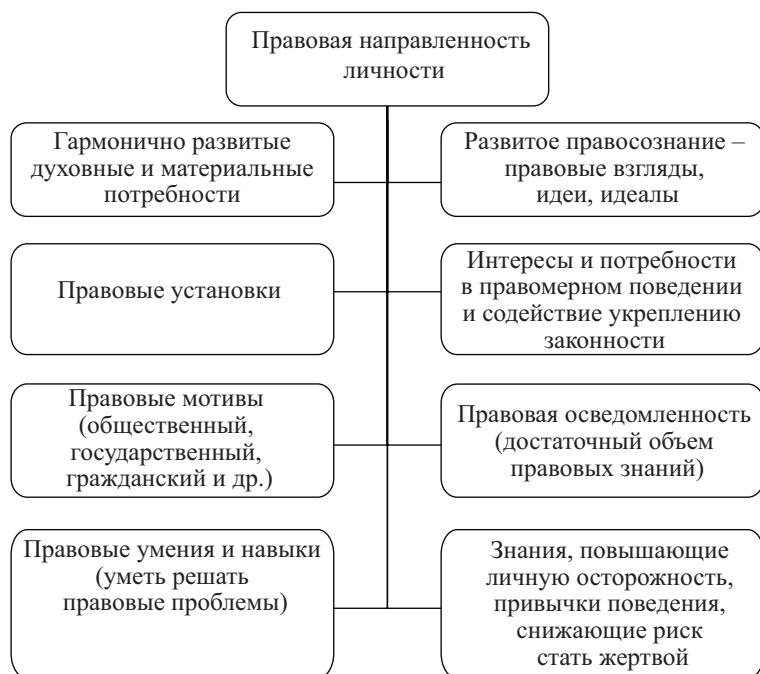
Рис. 4. Правовая направленность личности

граждан подчиняться этим единым нормам возможно реальное обеспечение прав и свобод, декларируемых Конституцией. Важное место в развитии правовой личности отводится воспитанию моральных качеств. Мораль и право – неразрывно связаны между собой. Гражданин общества, который усвоил такие ценности, как честность, порядочность, добросовестность, человечность, ответственность, организованность, требовательность к самому себе, интуитивно понимает, что в жизни справедливо, а что – нет. В словаре В.И. Даля (1801–1872) «мораль» соотносится с нравучением, нравственным учением, правилами для воли, совести. Основными понятиями морали являются «добро» и «зло», «правильное» и «неправильное», «честь» и «долг», «стыд», «совесть», «счастье» и др. Мораль – это форма общественного сознания и вид общественных отношений, направленных на утверждение самооценности личности, равенства всех людей в их стремлении к счастливой и достойной жизни, выражающих идеал человечности.